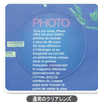
通常のクリアレンズ